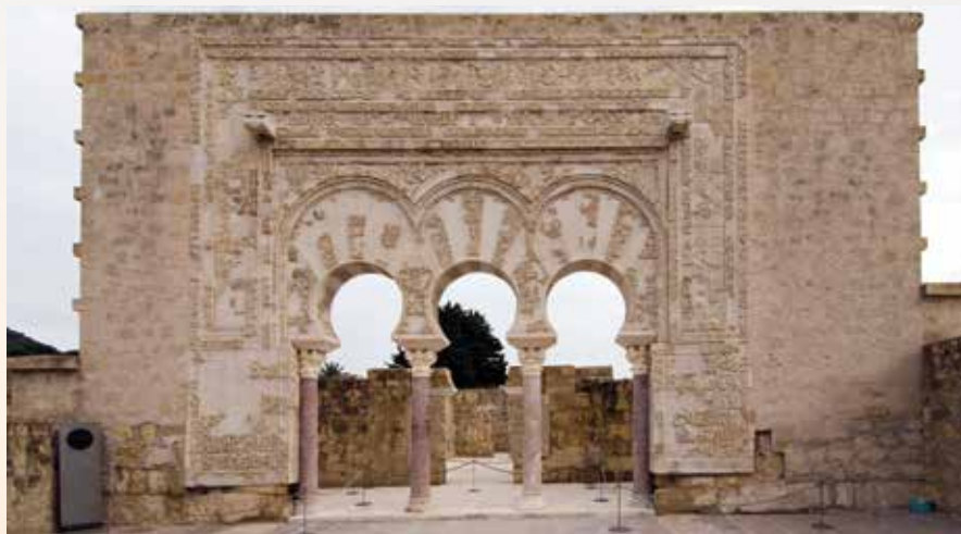
La Casa de Ya'far, lugar favorito de la Alcaldesa en Medina Azahara.

La práctica totalidad de nuestro flujo turístico, de más un millón de visitan-